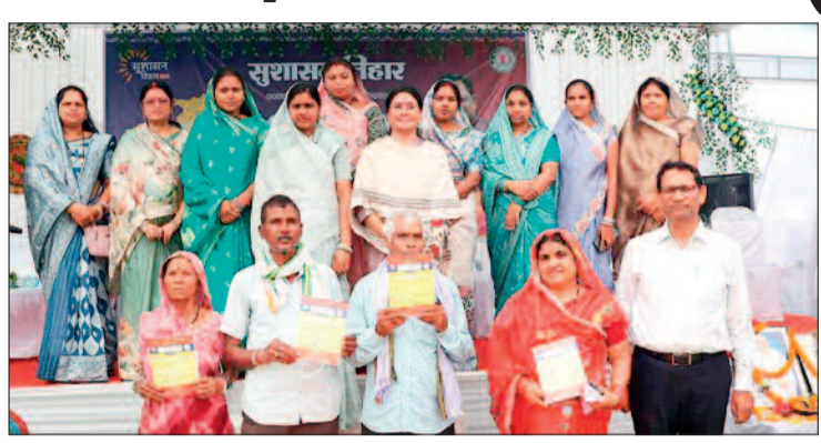
हरिभूमि न्यूज ►► बालोद/दल्लीराजहरा

शिविर के दौरान मानवीय संवेदनशीलता का भी उदाहरण देखने को मिला, जब एक बीमार व्यक्ति को स्थिति को गंभीरता से लेते हुए तत्काल उपचार सुनिश्चित करने के निर्देश