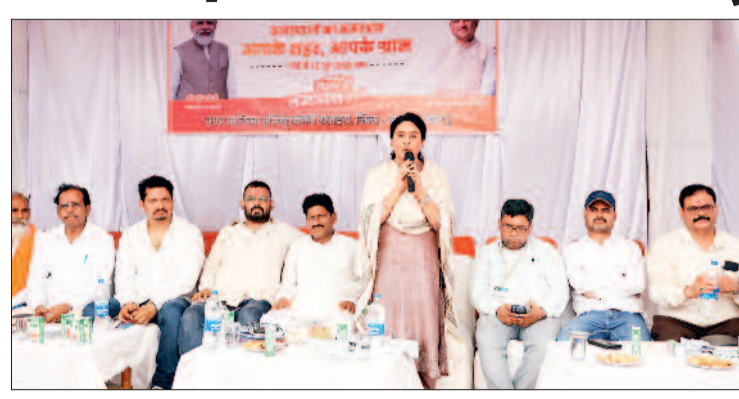
हरिभूमि न्यूज ►► बालोद/दल्लीराजहरा

सुशासन तिहार 2026 आयोजित जनसमस्या निवारण शिविरों ने प्रशासन की सक्रियता और जनहित के प्रति प्रतिबद्धता का मजबूत संदेश दिया। नगर पालिका परिषद दल्लीराजहरा परिसर में आयोजित शिविर में ग्रामीणों और शहरी नागरिकों की भारी भीड़ उमड़ी, जहां मौके पर ही समस्याओं का समाधान कर लोगों को राहत पहुंचाई गई।